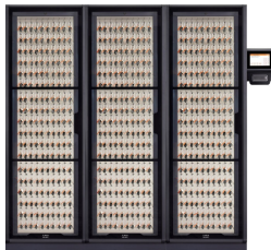
540 system (2126mm b)