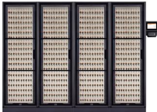
720 system (2766mm b)